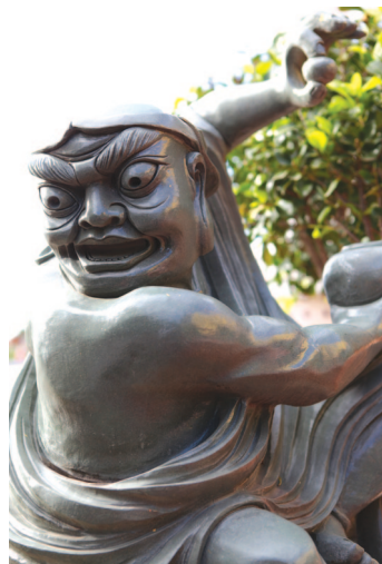
Tượng A La Hán Statue of Arhat 羅漢像 阿羅漢像