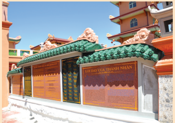
Bảo tháp Tứ Ân Benefactor Stupa 四恩寶塔 四恩寶塔