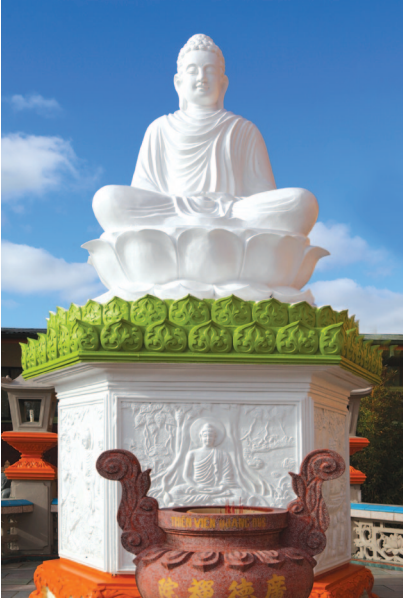
Tượng đài đức Phật Thích Ca Monument of Shakyamuni Buddha 釋迦佛台 釋迦牟尼像