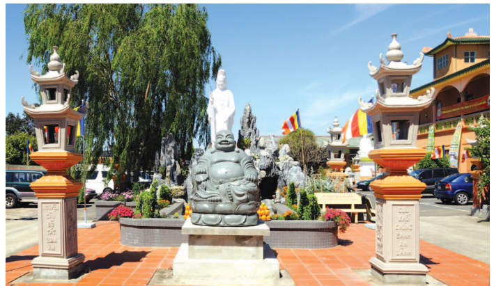
Tam quan tu viện Tri-Gate 修院山門 三門